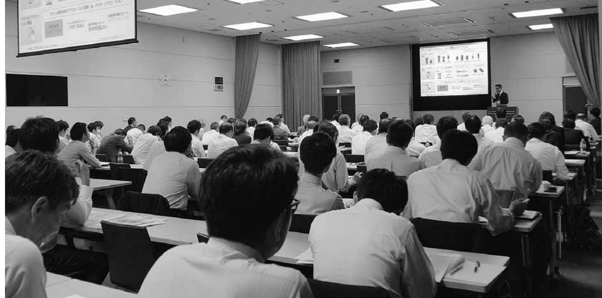
各地のガス事業者が参加した

事業者が積極的にエンタープライズしている例もある。市のスマートコミュニティ計画にガス事業者が中心的に参加するなど、エネ以外の地域活動事例も増えてきた。これらのさまざまな先進事例を参考にしつつ、まずはそれぞれの事業者が置かれている実情に即して、できることから取り組んでいくことが大事ではないかと考える。